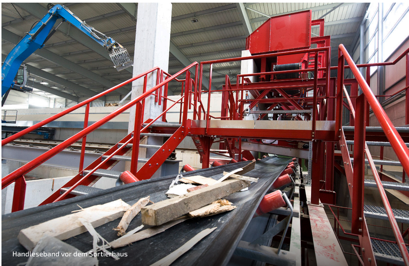
Handleseband vor dem Sortierhaus