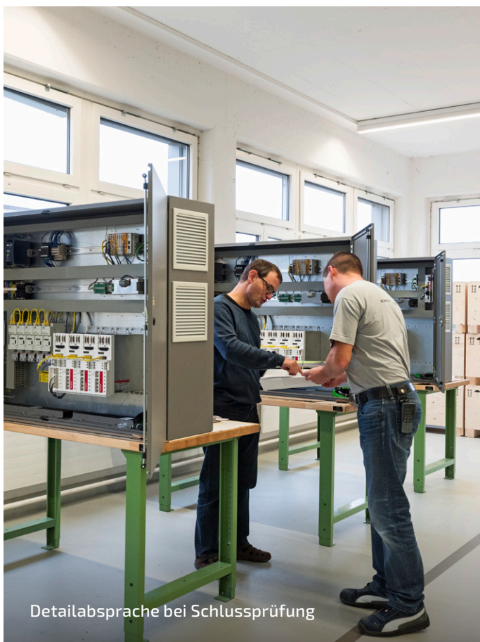
Detailabsprache bei Schlussprüfung